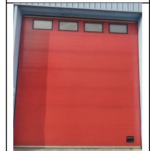
Behandeld met: MPS REFRESH . Na één keer inwrijven.