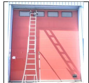
Sectionale industriële deur, 12 jaar oud, schoongemaakt.